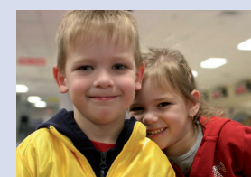
IV. Crescere con i figli febbraio - marzo 2012